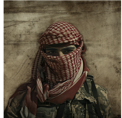
Bilder skapade i Midjourney

Den här filmen visar med ännu större tydlighet hur bias kan reproduceras i bildgeneratorer