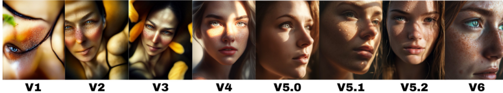
Midjourney Version Comparison

Att ta fram bilder med hjälp av tjänster som Midjourney , Dalle 3 , Leonardo , Ideogram eller Stabel Diffusion är en kreativ process. Bildgeneratorerna är tränade på miljontals bilder och det börjar nu bli svårt att skilja en AI-genererad bild från en verklig bild. Det har skett en enorm utveckling vad gäller bildgeneratorer den senaste tiden. Bilden nedan visar utvecklingen av tjänsten Midjourney. Från version 1 till dagens version 6