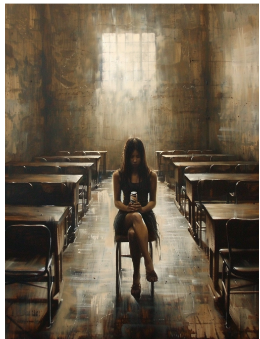
A surrealistic painting of a tired highschool drinking an energy drink in a dimly lit classroom. In the style of Caspar David Friedrich.